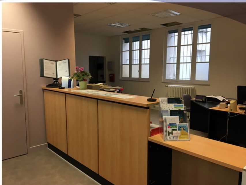
Accueil et bureau des agents administratifs

Et voici un aperçu de votre nouvelle mairie.