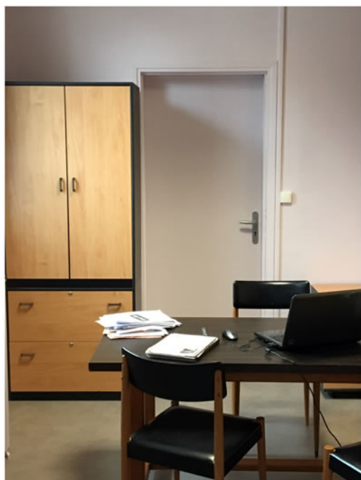
Bureau de Madame le Maire