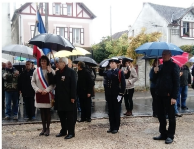
centenaire de l'Armistice du 11 novembre 1918