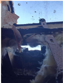
trou dans la toiture

Des tuiles plates flammées ont été choisies pour garder l'harmonie entre les bâtiments Mairie / Eglise et respecter le style architectural de l'ensemble.