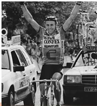
Victoire du Tour de France 1980