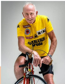
Joop Zoetemelk 2020