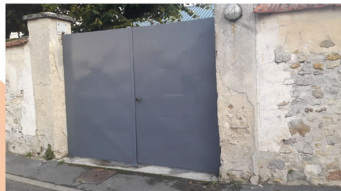
salle ruelle aux loups

Un rafraîchissement complet des portails du cimetière, de la salle ruelle aux loups et de la mairie a été effectué. Les travaux ont été confiés à l'entreprise Touret pour un montant de 3 591€ TTC.