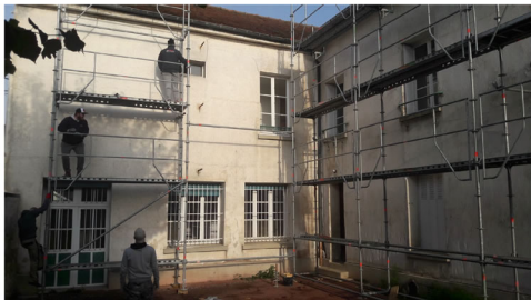
travaux de la réfection de la toiture de la mairie