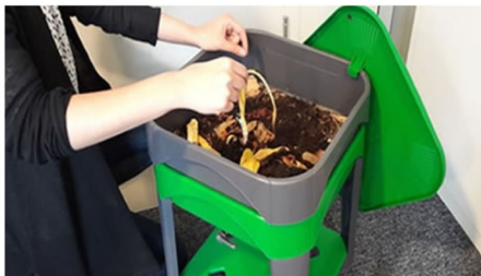
Le lombricomposteur pour un compostage en appartement