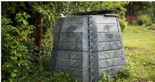
photographie non contractuelle

Pour plus d'informations, vous pouvez contacter le Smitom au 01 60 44 40 03 ou la Communauté d'Agglomération du Pays de Meaux au : 01 60 01 29 77.